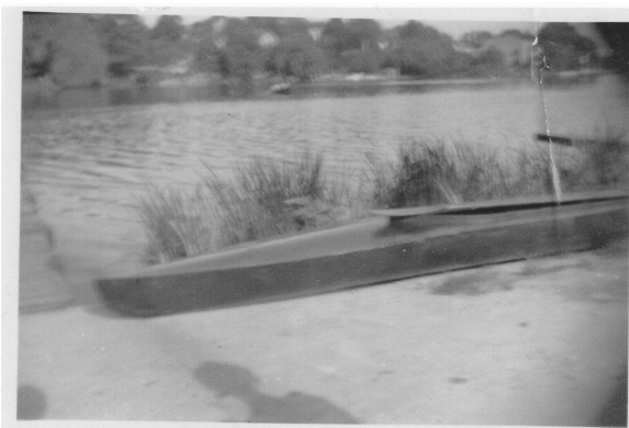
Abbildung 2: Mein erstes selbstgebautes Boot

Schließlich ist Stillstand die langweiligste aller Tätigkeiten, und so kam dann ein Segel (altes Bettlaken) an einem Rundholz zum Einsatz. Kreuzen war nicht angesagt, weil ein Schwert fehlte. Der Sinn eines solchen hatte sich mir mit meinen 13 Lenzen auch noch nicht erschlossen.