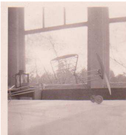
Abbildung 1: Erstes Flugmodell mit Gummimotor

In der 6. Klasse unserer Grundschule „Bruno H. Bürgel“ wurde eine Arbeitsgemeinschaft „Modellbau“ gegründet. Wir fingen an die Teile für das Modell „Pionier“ her zu stellen. Das ging mir gut von der Hand. Mein Vater als Tischlersohn hat gern und sehr gut mit Holz umgehen können, und so wurde mir wohl auch das Holzwurm-Gen in die Wiege mitgegeben. Der Leiter unserer Bastel-AG hatte als Schuldirektor sicher schon damals allerhand lästigen Papierkram zu erledigen. So beauftragte er mich, wenn er seinen Büroaufgaben nachging, mit der Anleitung meiner Mitschüler im Umgang mit Laubsäge und Klebstoff.